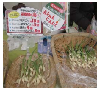
▲ 生の「赤ちゃんにんにく」を販売