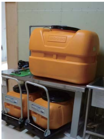
▲「ナノバブル」発生装置

NPO 法人あい・友ではこのほど、「あい・友農園青木村」で生産している芽子にんにくを、「赤ちゃんにんにく」と名前を変えました。商標登録も取得し、新たなステージに踏み出すことになりましたが、たくさんの方から、「可愛い名前だ」、「いい名前だね」と