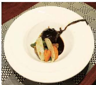
▲「ミートボールと赤ちゃんにんにく」

東京からは、あい・友のメンバーや関係の方がお手伝いに来てくださいました。シェフのご家族（奥様と娘さん達）も応援に駆け付けてくださり、一生懸命、お客様を呼び込んでくださいました。