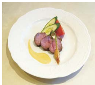
▲「仔羊肉と赤ちゃんにんにく」