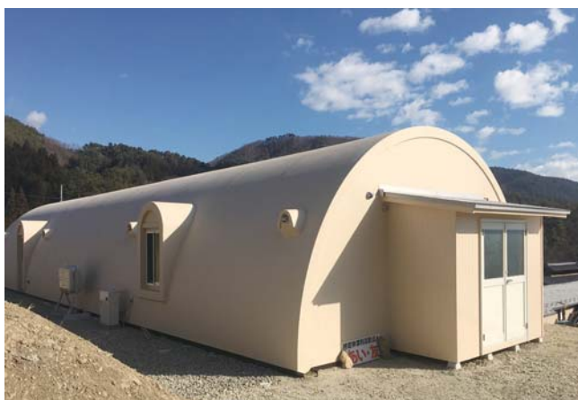
▲完成した「ドームハウス」

「赤ちゃんにんにく」を作っている植物工場は密閉型ドームハウスです。24メートル×7メートルの広さで、半円形をした建物です。そばには青木村の象徴である子檀嶺岳（こまゆみだけ）と羊牧場。そしてなによりきれいな空気と澄んだ水に囲まれています。そのひととき目立つ建物の中で、ゆっくりと育っているのが「赤ちゃんにんにく」です。ひとつひ