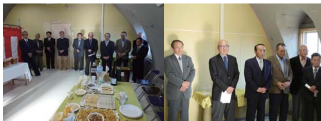
▲村長をお招きして「ドームハウス」の落成記念パーティー

植物工場の中は一定の温度に保たれています。入口には、外から来る埃を払うために強い風が噴出（エアーカーテン）しています。働く人たちは靴をはきかえ、頭にはキャップをかぶり、マスクをし、手袋をして、洋服を着替えて栽培室に入ります。栽培室でもエアー（風の仕切りがあります）を浴びます。栽培室には特製のベットにおさまっている「赤ちゃんにんにく」が整然と並び、LEDの赤や青の光線（時期によって変わります）が、当てられています。酸素リッチな新しい水が加えられ、ますます優雅に育っていくのです。