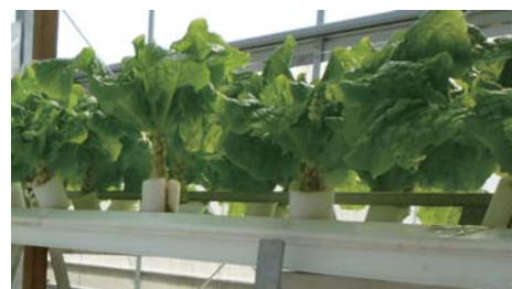
▲農園内で育つ新鮮なサンチュ

将来的には、ハウス工場の全国展開を視野に100ヶ所程度の規模を考えています。これによりFECグループ企業の地域社会への貢献が出来るものと考えています。