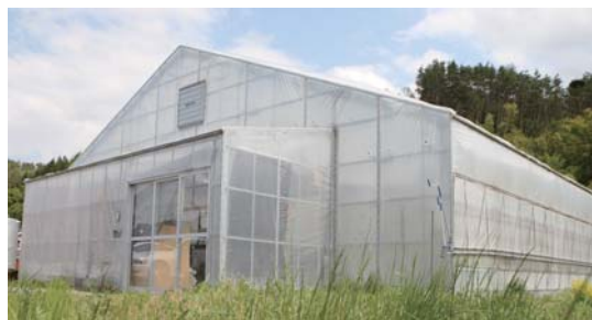
▲自然豊かな青木村にある「NPO 法人あい・友農園－青木村」